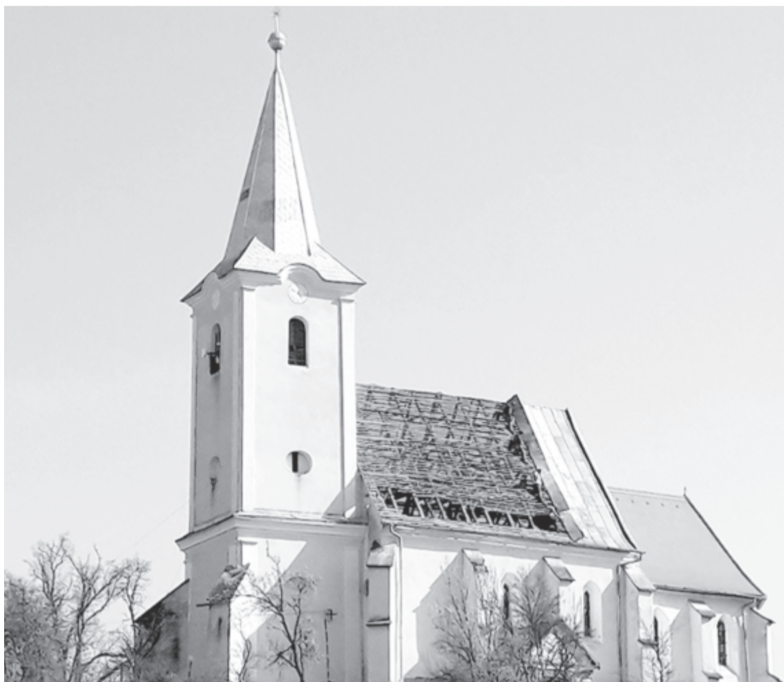
Elkezdődött a szentgericei unitáriusok 14. századi templomának felújítása – ezt is támogatja a BGA