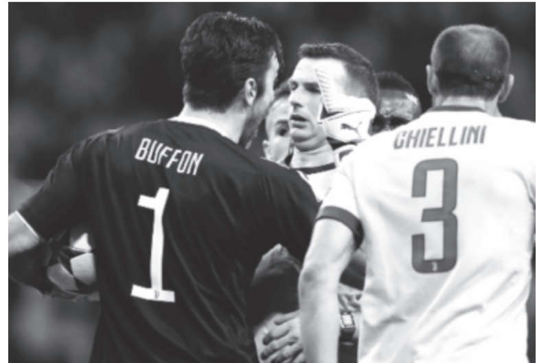
Michel Oliver játékvezető (k) rémült arckifejezéssel a Juventus kapusával, Gianluigi Buffonnal szemben. Aztán előhúzta a piros lapot

A megítélt büntetőt Cristiano Ronaldo értékesítette, ezzel a Real Madrid jutott az elődöntőbe.