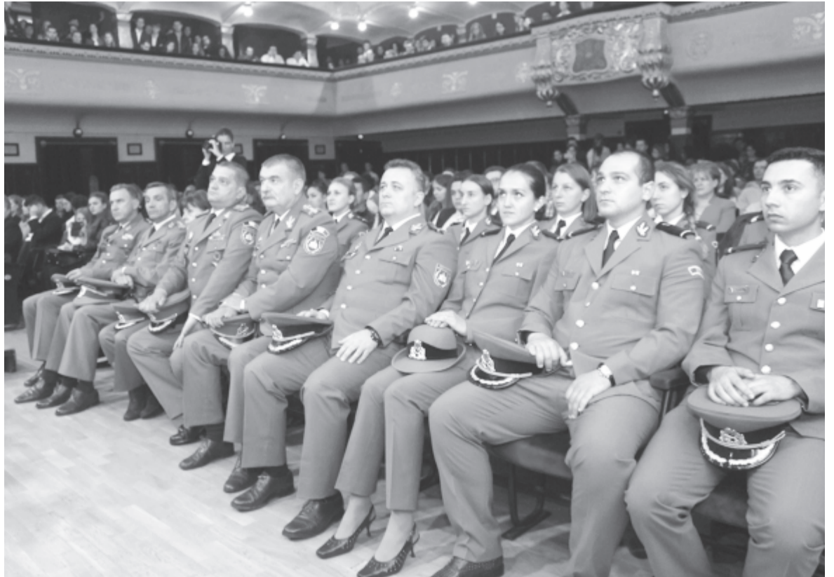
Katonaorvosok a 2017-es tanévnyitón