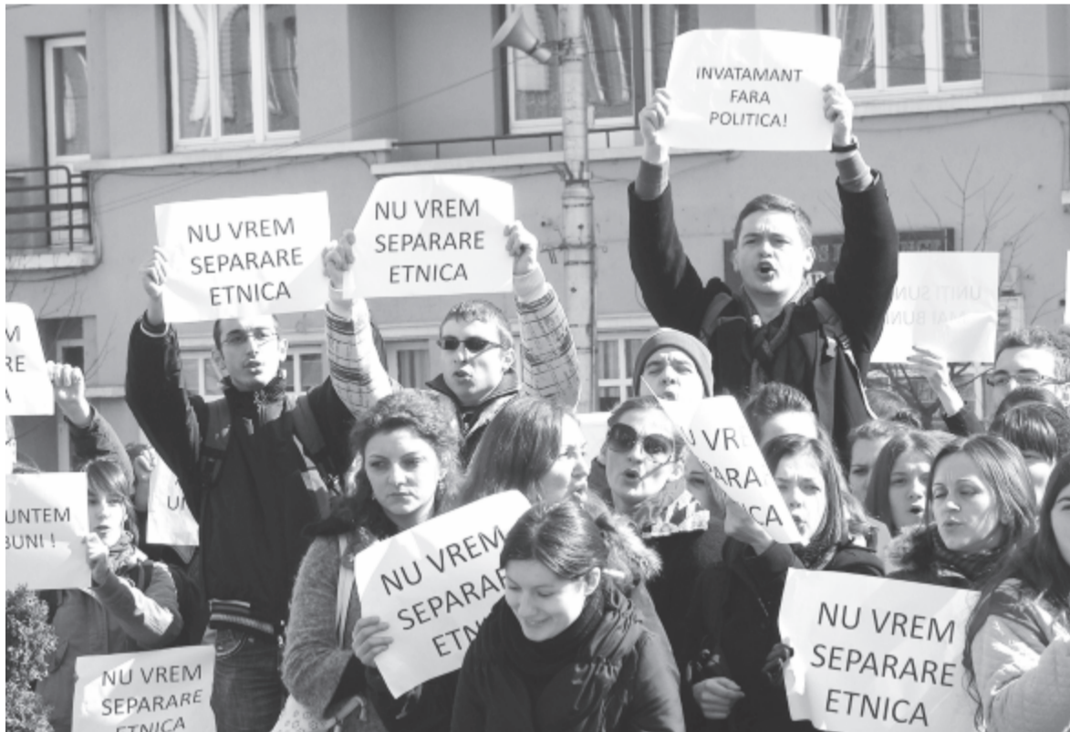
Multikulti diákok tüntetése 2012-ben

Ha nem sikerül elhalasztatni a szerdára tervezett szenátusi gyűlést, jóváhagyásra kerül az egyesülési határozat. Ebben az áll, hogy a MOGYE megőrzi eddigi státusát, jogi személyiségét, adószámát, és bekebelezve a Petru Maior Egyetemet, névváltoztatással – Marosvásárhelyi Orvosi, Gyógyszerészeti, Tudomány- és Műszaki Egyetem (MOGYTM) néven – működik tovább. A határozat függeléke kitér az egyesítés feltételeire, a következő időszak felzárkóztatási lépéseire. De az igazi csapdát a 2.2-es pontba rejtették el, amelyben szavatolják az egyetem multikulturális jellegének a megőrzését, vagyis a román, magyar és angol nyelvű oktatás jelenlegi formáinak a megtartását. Ez köszönő viszonyban sincs a 2011/1-es tanügyi törvény 363-as cikkelyével, amely három romániai egyetemnek (a kolozsvári Babeş-Bolyai mellett a Marosvásárhelyi Művészeti Egyetemnek és a MOGYE-nak) multikulturális STATUST ír elő. Tehát a hét éve elodáztatott magyar tagozat és főtanszék létrehozásáról szó sincs. Amennyiben megvalósul a tervezett fúzió, és a szenátus kibővíti a műszaki egyetem csapatával, végleg búcsút intethetünk a magyar nyelvű orvostudomány újraéledésének.