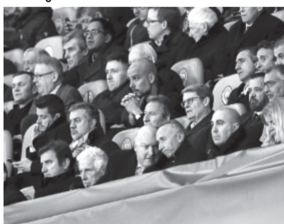
A Manchester City vezetőedzője (harmadik sor, 4.) a lelátóról volt kénytelen végignézni a Liverpool elleni negyeddöntős párharc visszavágó mérkőzésének második félidőjét

A mérkőzést 2-1-re a Liverpool nyerte, amely 5-1-es összesítéssel búcsúztatta a Manchester Cityt.