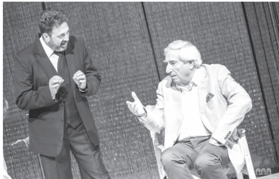
Jelenet Henrik Ibsen Ha mi holtak feltámadunk című darabjából, Wischer Johann-nal