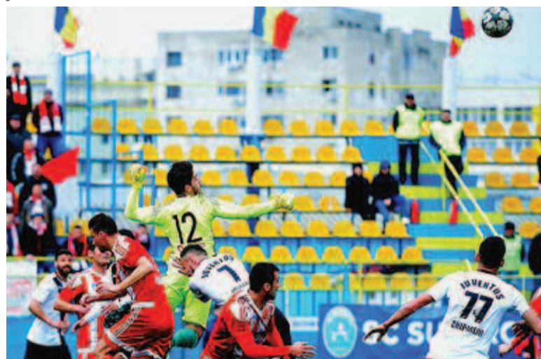
Pillanatfelvétel a Bukaresti Juventus – Seps OSK mérkőzésről. A háromszékiek végül mindenféle szempontból jól jártak

A Romániai Magyar Demokrata Szövetség (RMDSZ) székelyföldi képviselői és szenátorai szerdán a román labdarúgó-válogatott volt szövetségi kapitányához, Anghel Iordănescuhoz fordultak, arra kérve a köztisztviselőket álló sportembert, hogy határolódjon el mindattól, ami a nevét viselő stadionban a mérkőzés előtt történt.